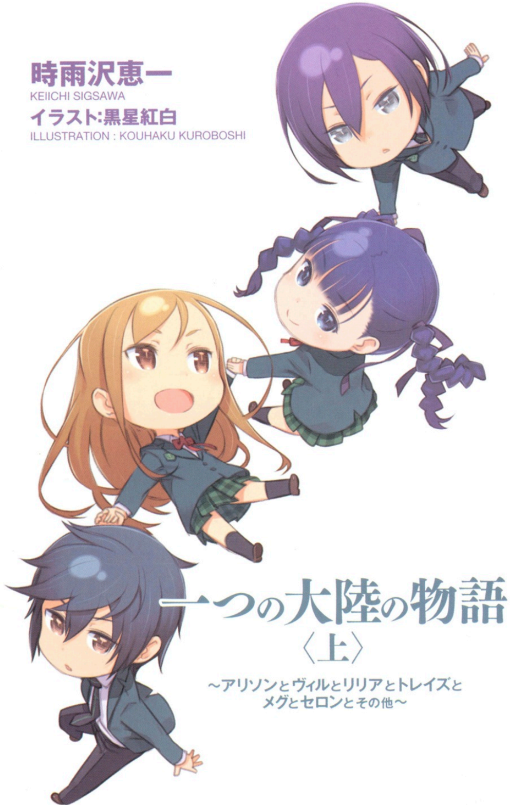
ILLUSTRATION : KOUHAKU KUROBOSHI